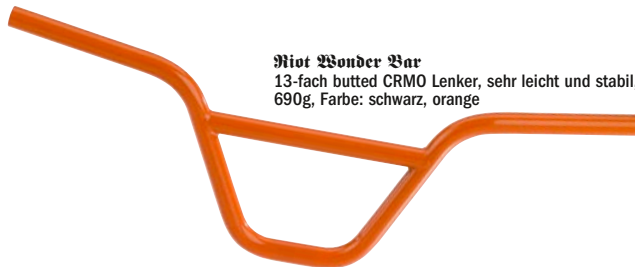
Root Wonder Bar 13-fach butted CRMO Lenker, sehr leicht und stabil, 690g, Farbe: schwarz, orange