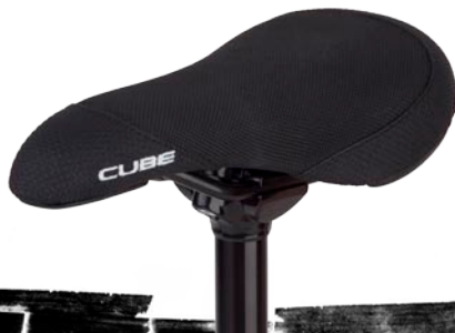
Root Smooth Nuts Seat leichter und stabiler Sattel mit CRMO Rails, 310g