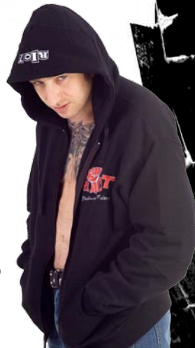
Riot Kapuzenzipper ②