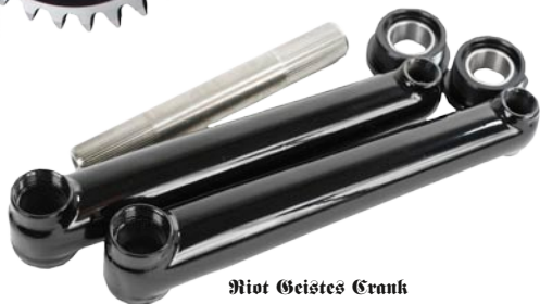
Root Geistes Crank 3-teile CRMO Hohlkurbel, 19mm Achse, 1060gr. mit Euro BB Lager oder ohne Lager