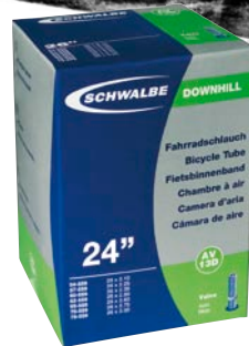
Schwalbe Schläuche - hoher Butyl-Anteil, sehr lufthaltig - hohe Nahtfestigkeit - hohe Ventilluftfestigkeit - im Vergleich mit Wettbewerbsprodukten relativ leicht