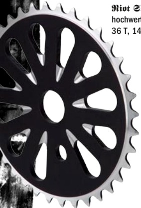
Root Zhuriken hochwertiges CNC gefrästetes Kettenblatt für Schaltketten, 36 T, 140g