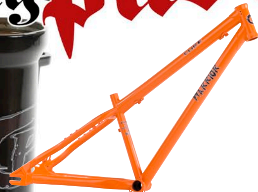
Cube Warrior Rahmen 4130 CRMO double butted Rahmen, Disc Brake und Canti Lever Mounts, abschraubbare Rotormounts, für 24" oder 26" Räder, Schalttauge einschiebbar in Langlochnut. Mounts für Kettentresor, ausgefräste Langloch Ausfallenden, Farbe: matt schwarz, burning orange