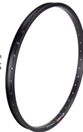
Alex 24" MTB Felge hochwertiger Felgenring, 36 Speichen