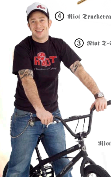
④ Riot Truckercap