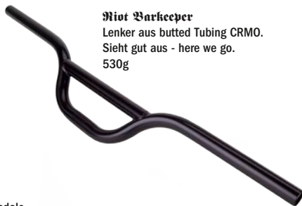
Root Barkeeper Lenker aus butted Tubing CRMO. Sieht gut aus - here we go. 530g