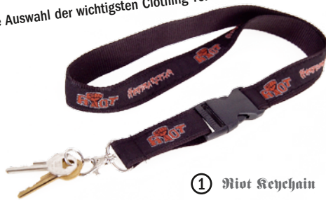
① Riot Keychain