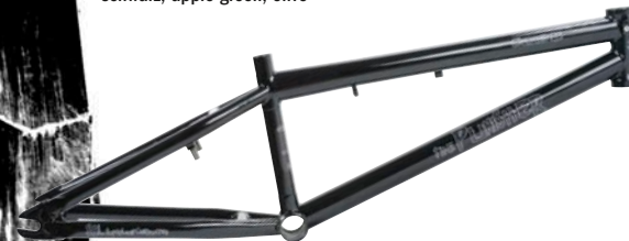
Cube Punisher Rahmen 4130 CRMO double butted Rahmen, Mid BB Tretlager, Semi integrated Headset, ausgefräste Ausfallenden, U-Brake Mounts, 3,2 kg, Farbe: schwarz, apple green, olive