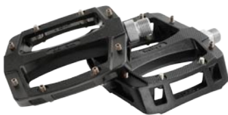
Root MG Pedale super leichte Magnesium Pedale, SB gelagert, 430g