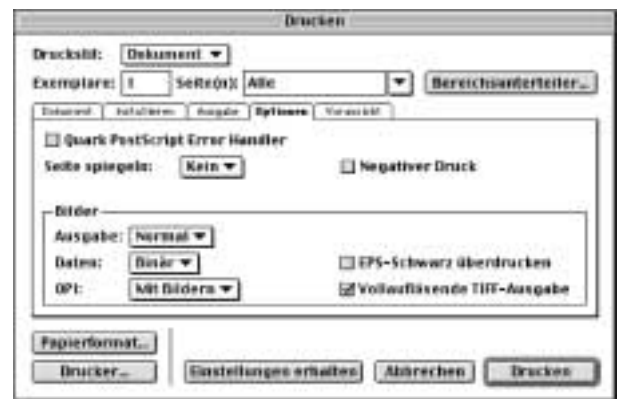
Einstellungen im XPress-Drucken-Dialog