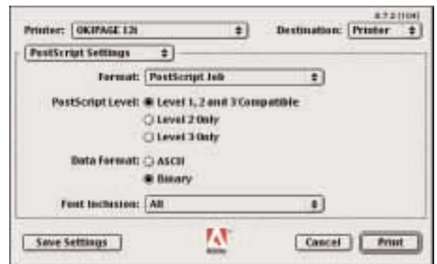
Einstellungen im Betriebssystem-Drucken-Dialog